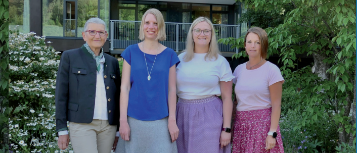
Sekretariat Allgemein-, Viszeral-, Thorax- & Endokrine Chirurgie