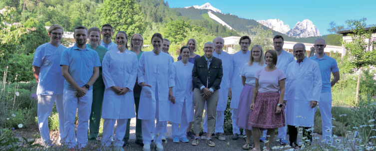
Gesamtes Team Allgemein-, Viszeral-, Thorax- & Endokrine Chirurgie